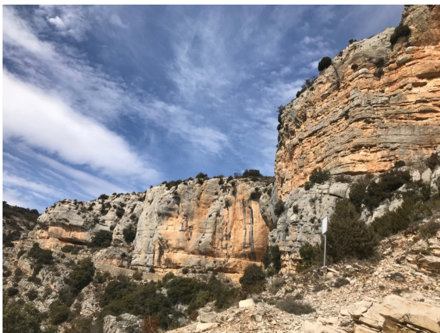
Jaciment paleontològic la Cabroa