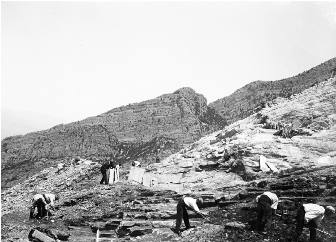
Miners a la pedrera de Meià, ca. 1900. Autor: Lluís Marià Vidal i Carrer