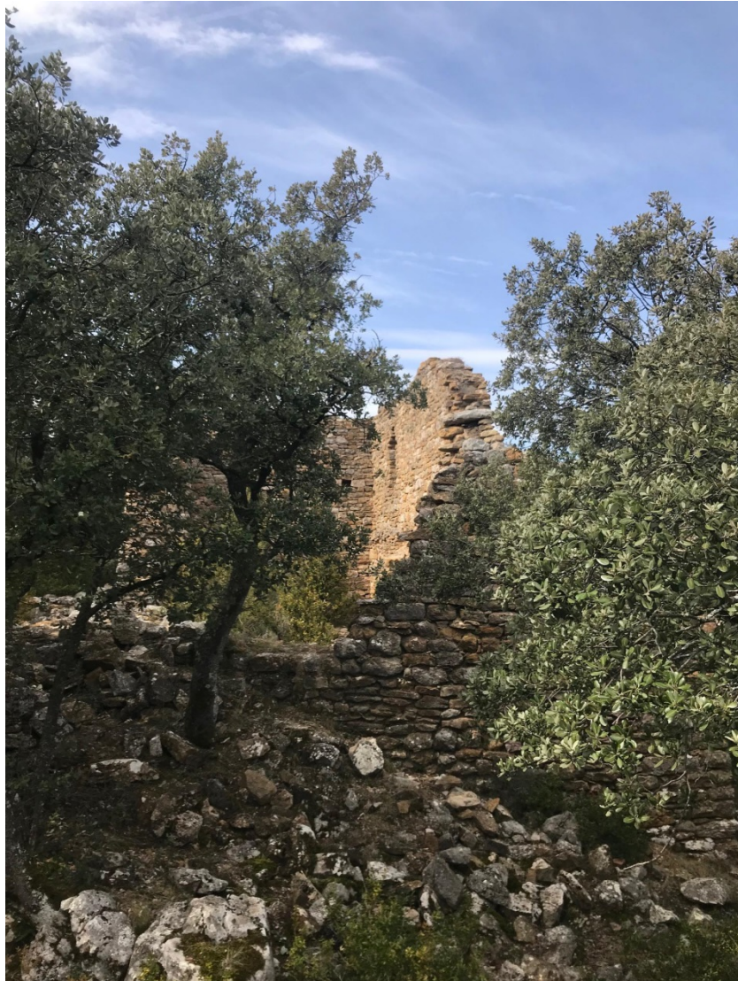
L'antiga vila de Meià