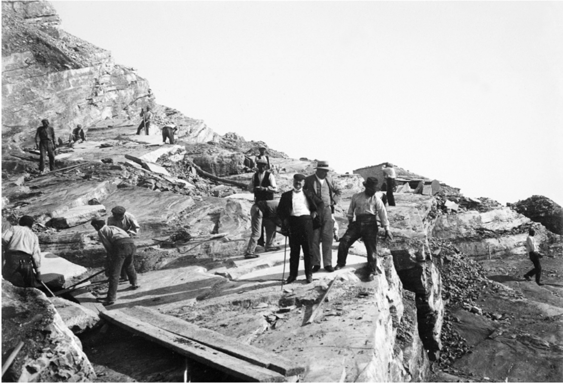
Pedrera de Meià, ca. 1900. Autor: Lluís Marià Vidal i Carreras